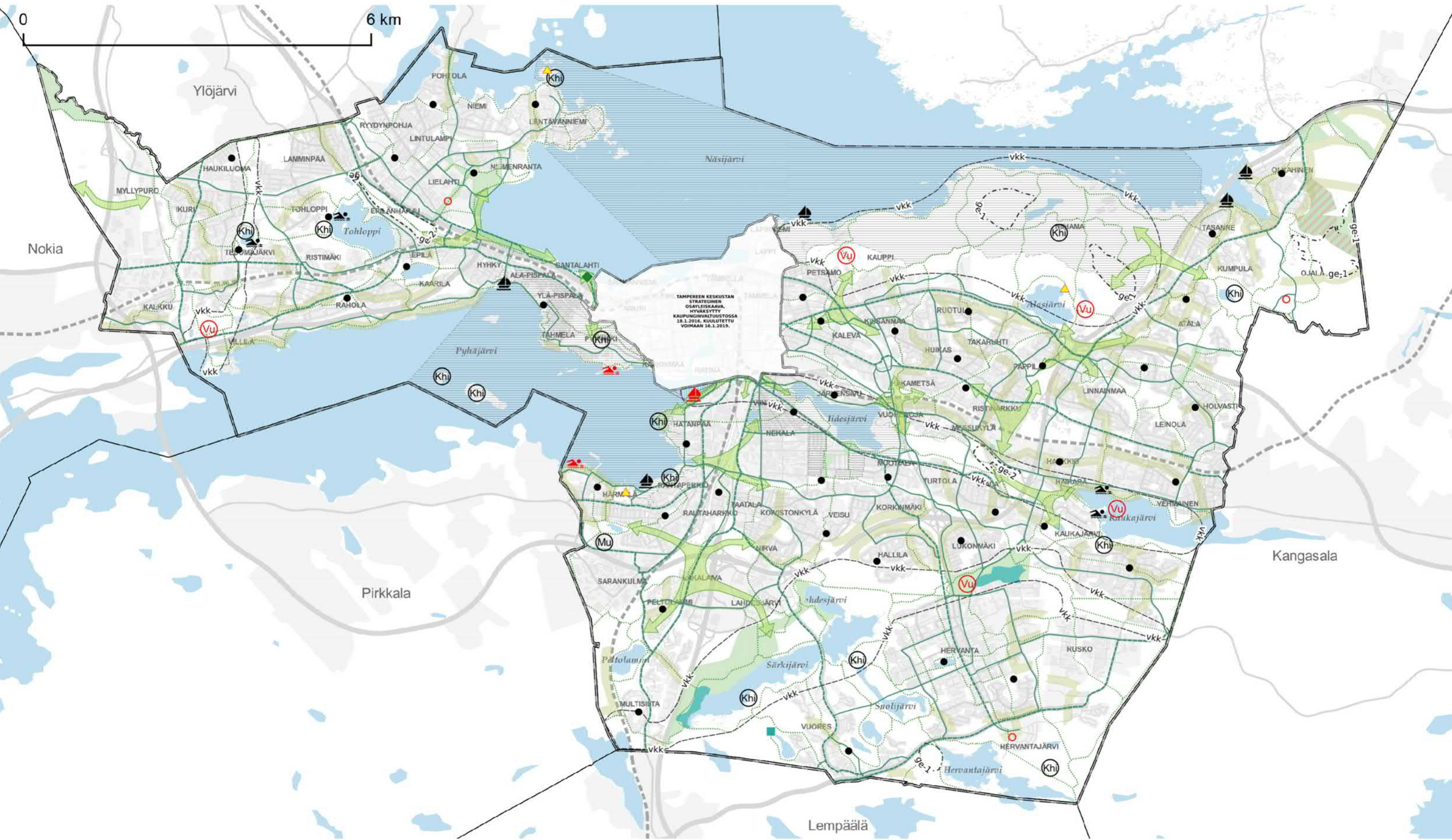
KARTTA 2 - VIHERYMPÄRISTÖ JA VAPAA-AJAN PALVELUT

Hyväksytty kaupunginvaltuustossa 17.5.2021. Hallinto-oikeuden päätös valituksista 30.11.2022. Korkeimman hallinto-oikeuden päätös valituslupahakemuksesta 5.6.2023. Voimaantulo kuulus 9.6.2023