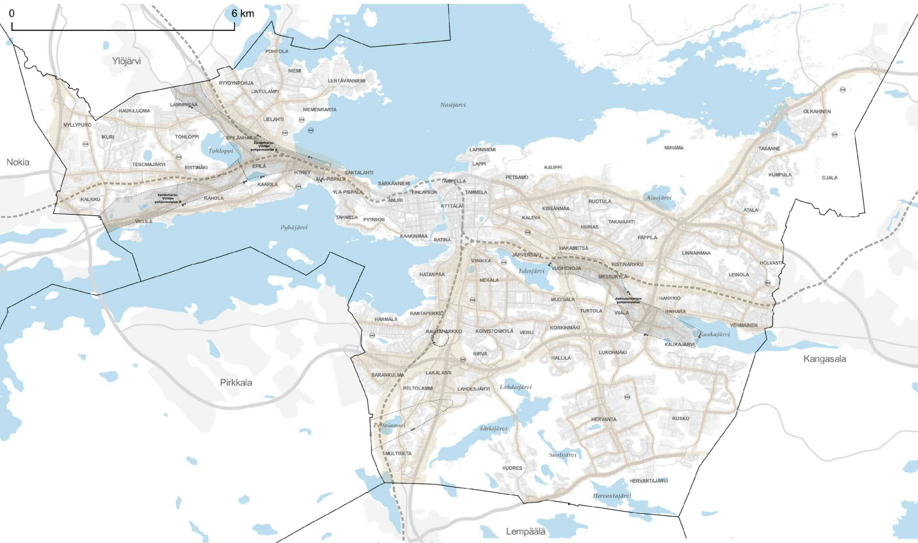
KARTTA 4 - KESTÄVÄ VESITALOUS, YMPÄRISTÖTERVEYS JA YHDYSKUNTATEKNINEN HUOLTO

Hyväksytty kaupunginvaltuustossa 17.5.2021. Hallinto-oikeuden päätös valituksista 30.11.2022. Korkeimman hallinto-oikeuden päätös valituslupahakemuksesta 5.6.2023. Voimaantulojulutus 9.6.2023.