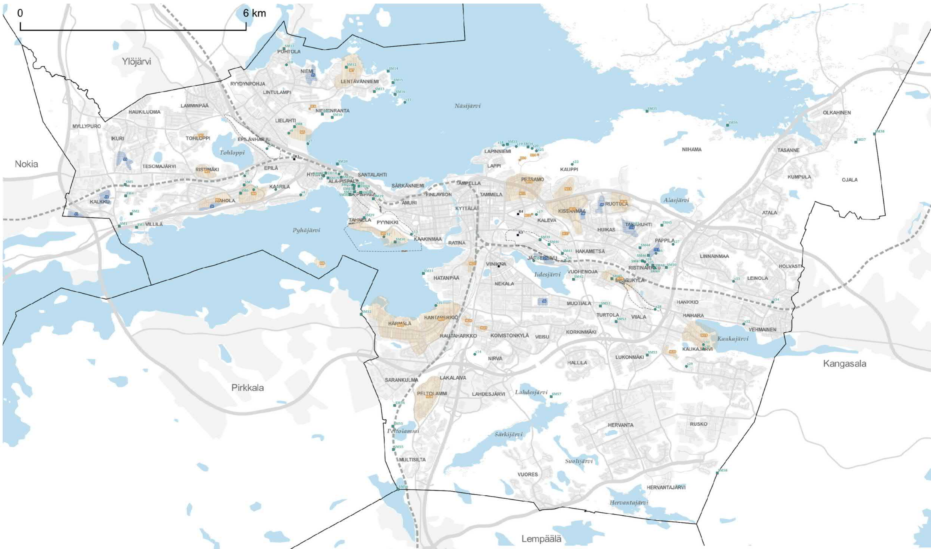
KARTTA 3 - KULTTUURIPERINTÖ

Hyväksytty kaupunginvaltuustossa 17.5.2021. Hallinto-oikeuden päätös valituksista 30.11.2022. Korkeimman hallinto-oikeuden päätös valituslupahakemuksesta 5.6.2023. Voimaantulojulutus 9.6.2023