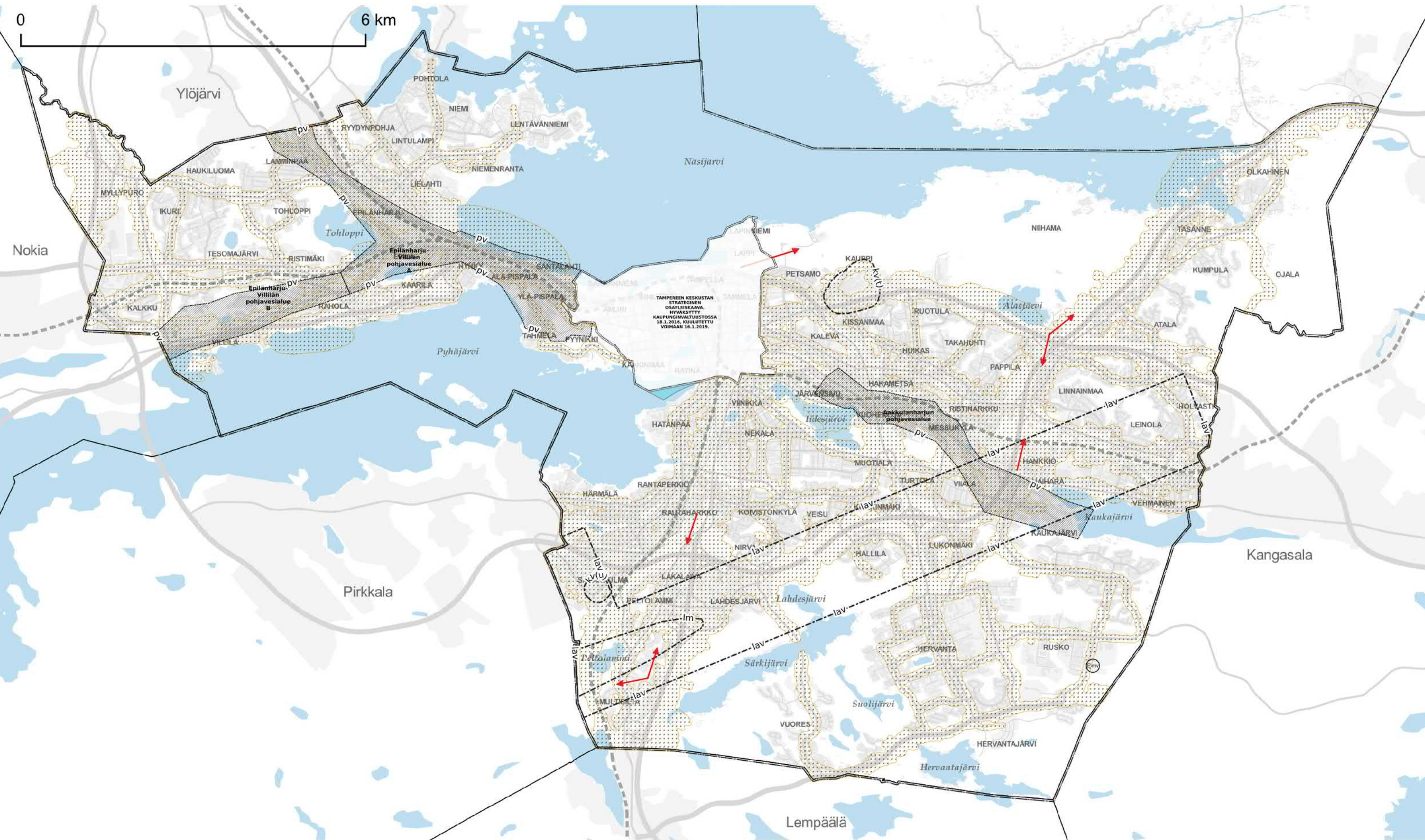
KARTTA 4 - KESTÄVÄ VESITALOUS, YMPÄRISTÖTERVEYS JA YHDYSKUNTATEKNINEN HUOLTO

Hyväksytty kaupunginvaltuustossa 17.5.2021. Hallinto-oikeuden päätös valituksista 30.11.2022. Korkeimman hallinto-oikeuden päätös valituslupahakemuksesta 5.6.2023. Voimaantulo kuulus 9.6.2023.